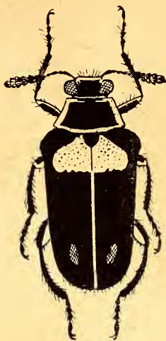
Fig. 2: Mastostethus columbianus n. sp.

Corps brillant à la partie supérieure, allongé, subparallèle, un peu atténué en arrière, avec quelques poils épars sur la partie inférieure, testacé ferrugineux, ayant une partie des cuisses, les jambes, les tarsi et une tache ronde sur chaque côté du prosternum, noirs. Tête lisse sauf les gros points de coutume entre les yeux, noire dans toute sa moitié postérieure. Antennes noires fortement élargies à partir du cinquième article. Prothorax très finement ponctué, en trapèze avec ses angles basiliaires aigus, sa base bisinuée, et une grande tache discale noire laissant seulement une fine bordure marginale de la couleur du corps. Écusson noir, avec quelques fins points épars. Elytres fortement mais superficiellement ponctués, noirs avec une grande tache subtriangulaire commune, de la couleur du corps, ayant sa pointe échancrée par l'écusson, et deux petites taches, peu visibles, de la même couleur, dans la région apicale.